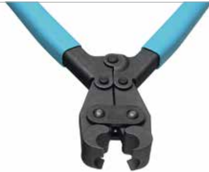
HIP 2000 | 387