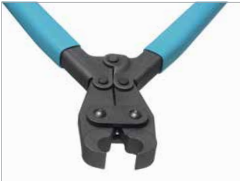
HIP 2000 | 386