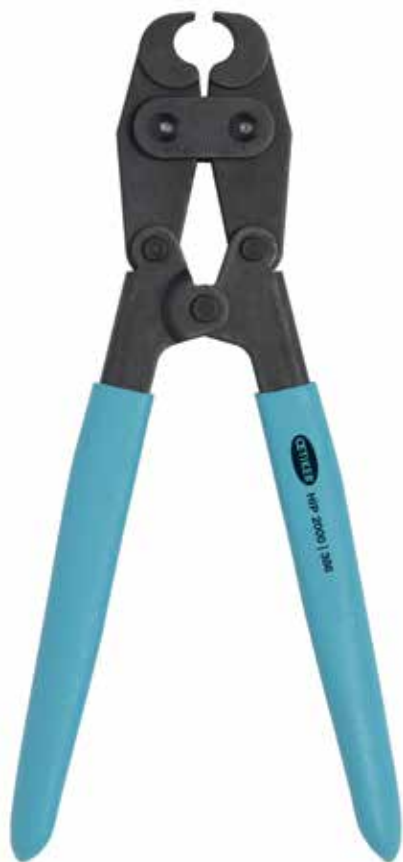
Tenaza de acción compuesta HIP 2000 | 386 N° de artículo 14100386