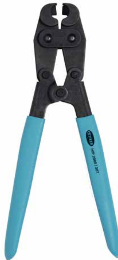
Tenaza de acción compuesta con mordaza lateral HIP 2000 | 387 N° de artículo 14100387

Herramientas de acción compuesta: más fácil de cerrar que con la acción simple (HIP)